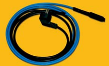
PPC - montážní sada automatický topný kabel s termostatem a vidlicí