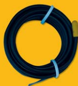
ST 1111 teplotní kabelové čidlo