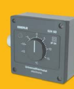
AZT prostorový termostat na zed'