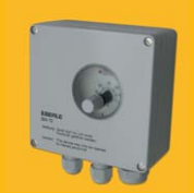
UTR termostat na zed' s vysokým krytím