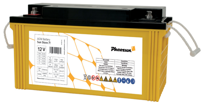
Sun Store 75

Die Phaesun Sun Store AGM Batterien sind sehr robust, wasserdicht, zyklusfest und haben eine lange Lebensdauer. Sie sind sehr effizient und am besten als Allround-Batterien geeignet.